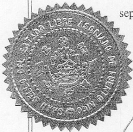
SILA M. CALDERON GOBERNADORA

EN TESTIMONIO DE LO CUAL, expido la presente bajo mi firma y hago estampar en ella el gran sello del Estado Libre Asociado de Puerto Rico, en la ciudad de San Juan, hoy día 10 de septiembre de 2002.